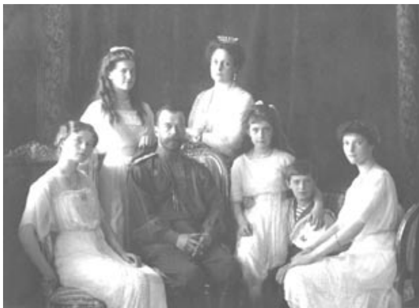
Den ryska tsarfamiljen avrättades i Jekaterinburg efter oktoberrevolutionen. Mycket debatt har sedan uppstått om huruvida en av döttrarna överlevde. Nu har forskare kunnat konstatera att far, mor och tre av döttrarna är de som hittades då graven öppnades på 1990-talet. Men kvarlevorna efter en dotter och efter tronföljaren Alexei saknas.

För att få säkrare slutsatser skickade man prover från alla de döda till England för DNA-analys. Och det är här det spännande ur släktforsknings-synpunkt börjar. Forskarna använde sig av mitokondrieanalys för att konstatera att det fanns ett släktskap mellande döda, och av en teknik som kallas STR (short tandem repeat) för att ta reda på om de tillhörde samma familjegrupp. STR innebär att ett